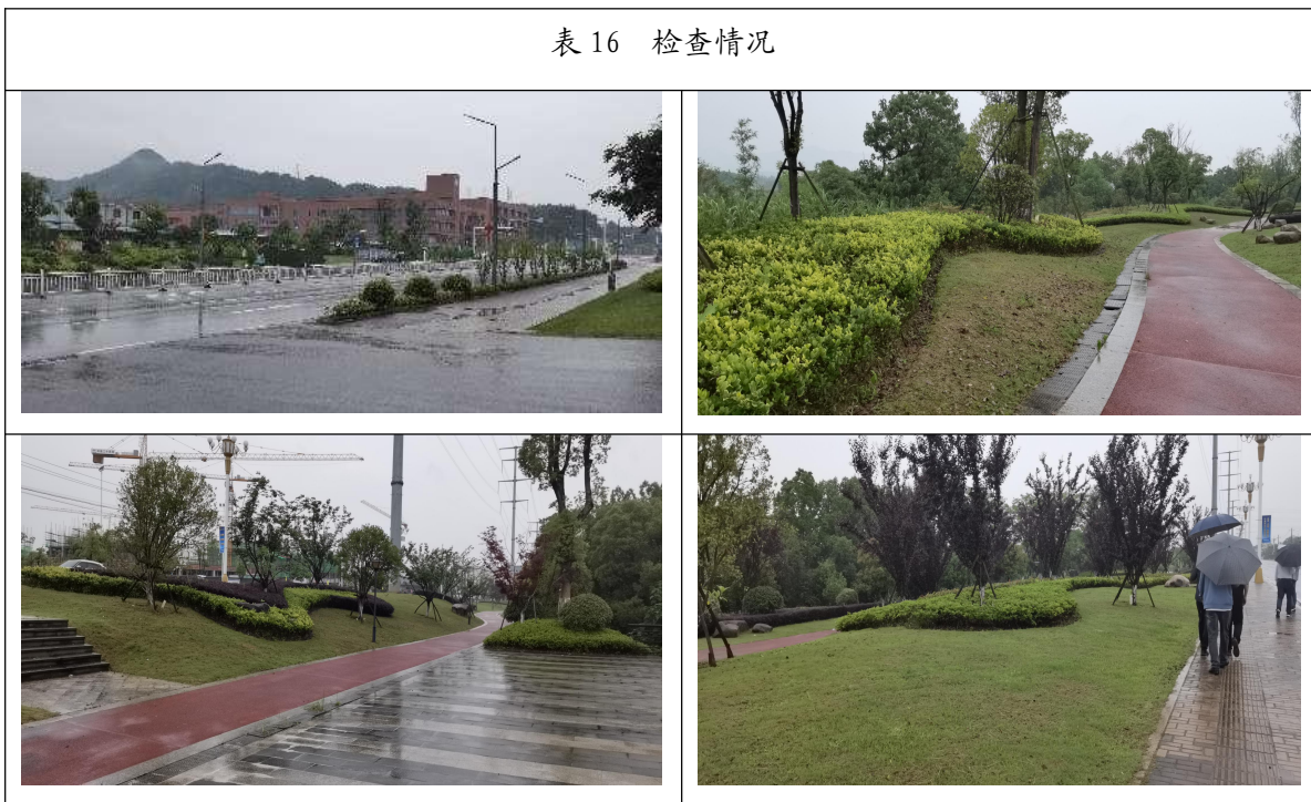
表 16 检查情况

根据评价指标的要求，绿化覆盖率、空气质量、生态环境权重分 2 分，得分 1 分；空气质量权重分 2 分，得分 2 分；生态环境权重分 2 分，得分 2 分。